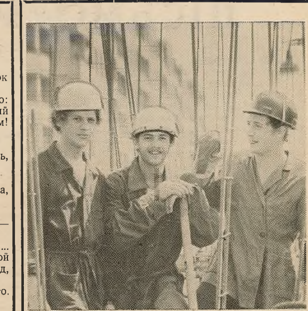
Вось яны, студэнты, байцы пяцігодкі, людзі справы, майстры высокага класа — будатрадаўцы. Лепшыя фарбы верасня — ім, самым цёплым промні вясенскага сонца — ім, ласкавым добрых слоў — таксама ім. Найлепшае спалучэнне, якое толькі змог захаваць фотааб'ектыў, — працавітыя, умелыя руні і адкрытыя твары, шчырыя ўсмешкі.

Последний, прощальный гудок Пронесся над городом До встречи — родительский дом! Любимые — до свиданья! Уйти со спецрейсамп вдаль, Уйти, и не ради награды, Уйти, чтобы помнить всегда, Рабочие будни отрядов. Ну что ж мне? Не брошусь им вслед — Мне строить другие объекты... Пусть каждый оставит свой след, И будет натруженным лето. Зеленые куртки бойцов Волнуют, как взгляды любимых, Как ветер, который в лицо, Как поезд, промчавшийся мимо... Л. КОЛБАСКО