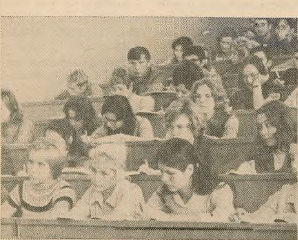
ПЕРШАЯ ЛЕКЦЫЯ НОВАГА СЕМЕСТРА

Вось і ўсё ўжо ззаду. Ззаду засталіся ўступныя экзамены і тая ні з чым не параўнальная боязь перад імі. Зараз вывесяць спіс, і яны — самі паступаючыя, іх бацькі — даведаюцца аб прозвішчах шчаслічыхаў. Напружаныя, нецярплівыя позіркі — ну, хутэй жа!